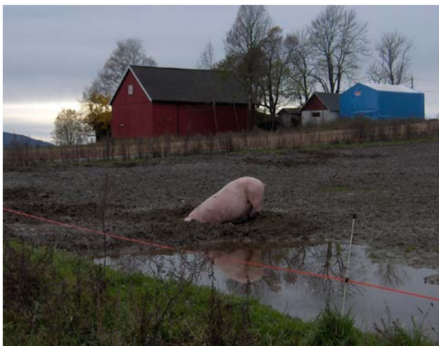
En av Torils griser i arbeid