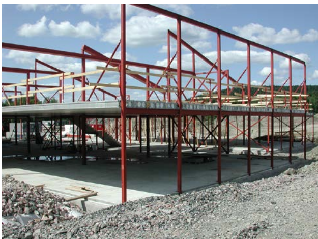
Spikkestad nye barneskole