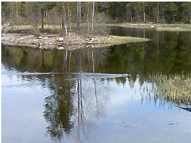
Fra Skapertjern uten snø og is