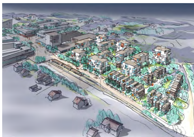
Her er en skisse av en tenkt utbygging på "Elopaktomta"

Med parkeringskjeller og uteområder av høy standard og med en andel Senior- og omsorgsboliger