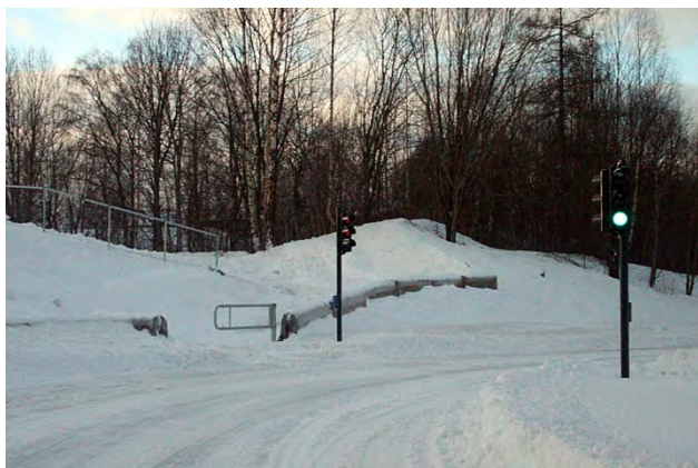
Her er det gangvei med trafikklys og bom. Vanskelig å brøyte?