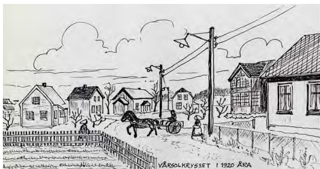
Her ser dere Varsolkryset i 1920-åra.

Forandring fryder sier noen, men ikke alle. Vi vil med bilder forsøke å se både bakover og fremover.